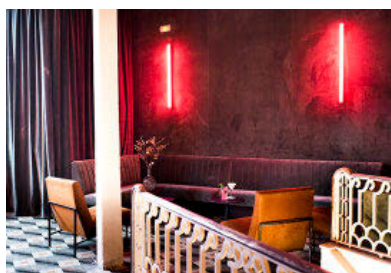
DE CINE. Arriba, entrada al restaurante. Sobre estas líneas, una de las zonas donde tomar un cóctel o picar algo.