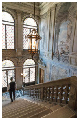
COMO UN PALACIO. La gran escalinata del hotel.

un baile de máscaras y cumplir ese sueño de vivir el carnaval de forma "princesca". El hotel ha llegado a un acuerdo para que sus huéspedes, si así lo desean, tengan entrada garantizada a Il Ballo del Doge, la exclusiva fiesta organizada en el Palazzo Pisani Moretta por la diseñadora Antonia Sautter (entre 800 y 3.000 euros entrada). Imprescindible: traje de época. Ellos se encargan de organizar, si lo eligen, las pruebas de trajes en el conocido taller de Sautter y enviar a las suites los disfraces ajustados a las medidas de los clientes. Esta noche, el espectáculo no está en La Fenice. Desde 1.000 euros. + aman.grandluxuryhotels.com; Calle Tiepolo Baiamonte, 1364. Venecia. Italia. Tel.: +39 041 270 7333.