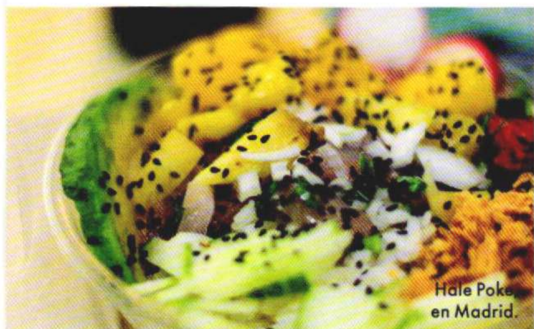
Hale Poke en Madrid.