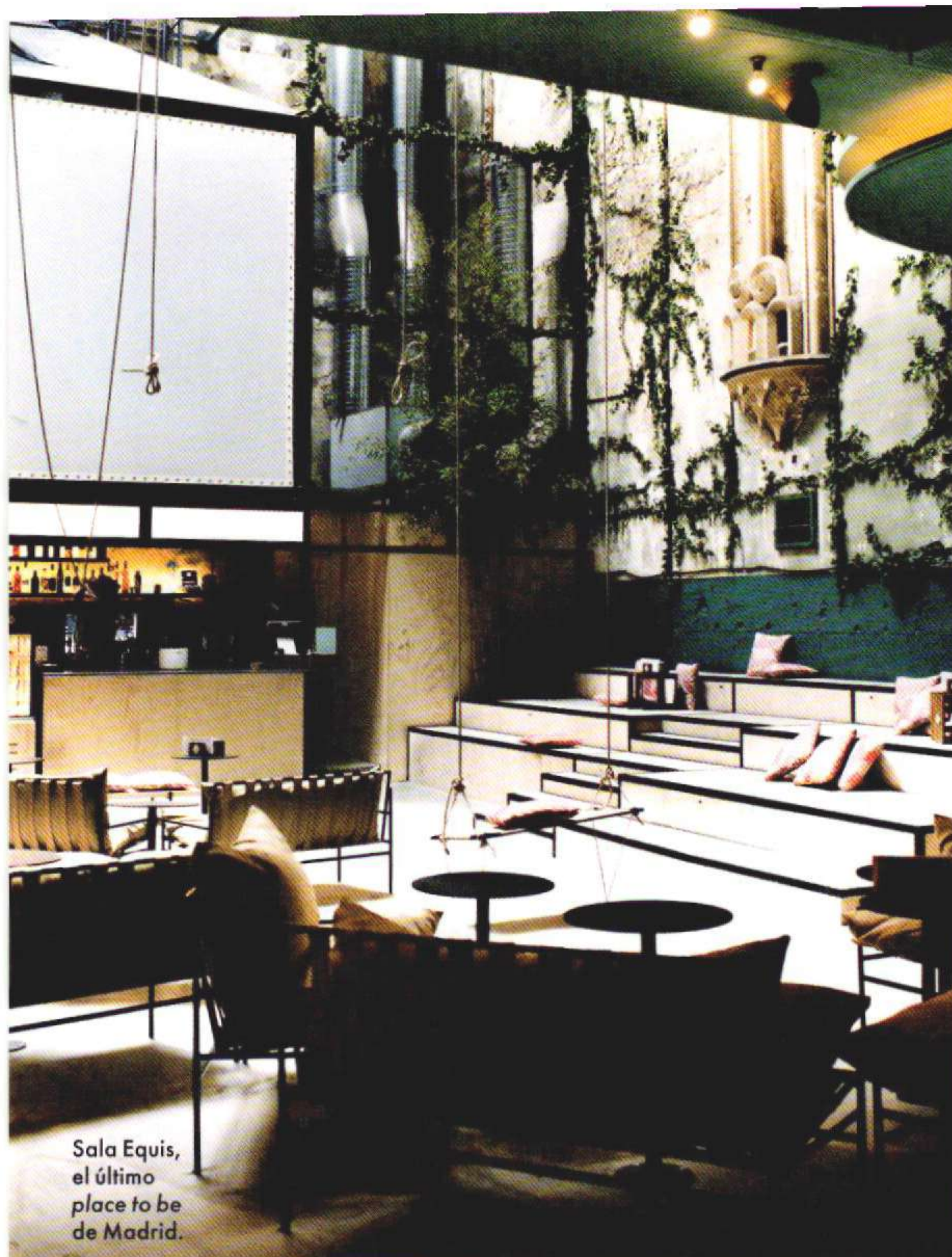
Sala Equis, el último place to be de Madrid.