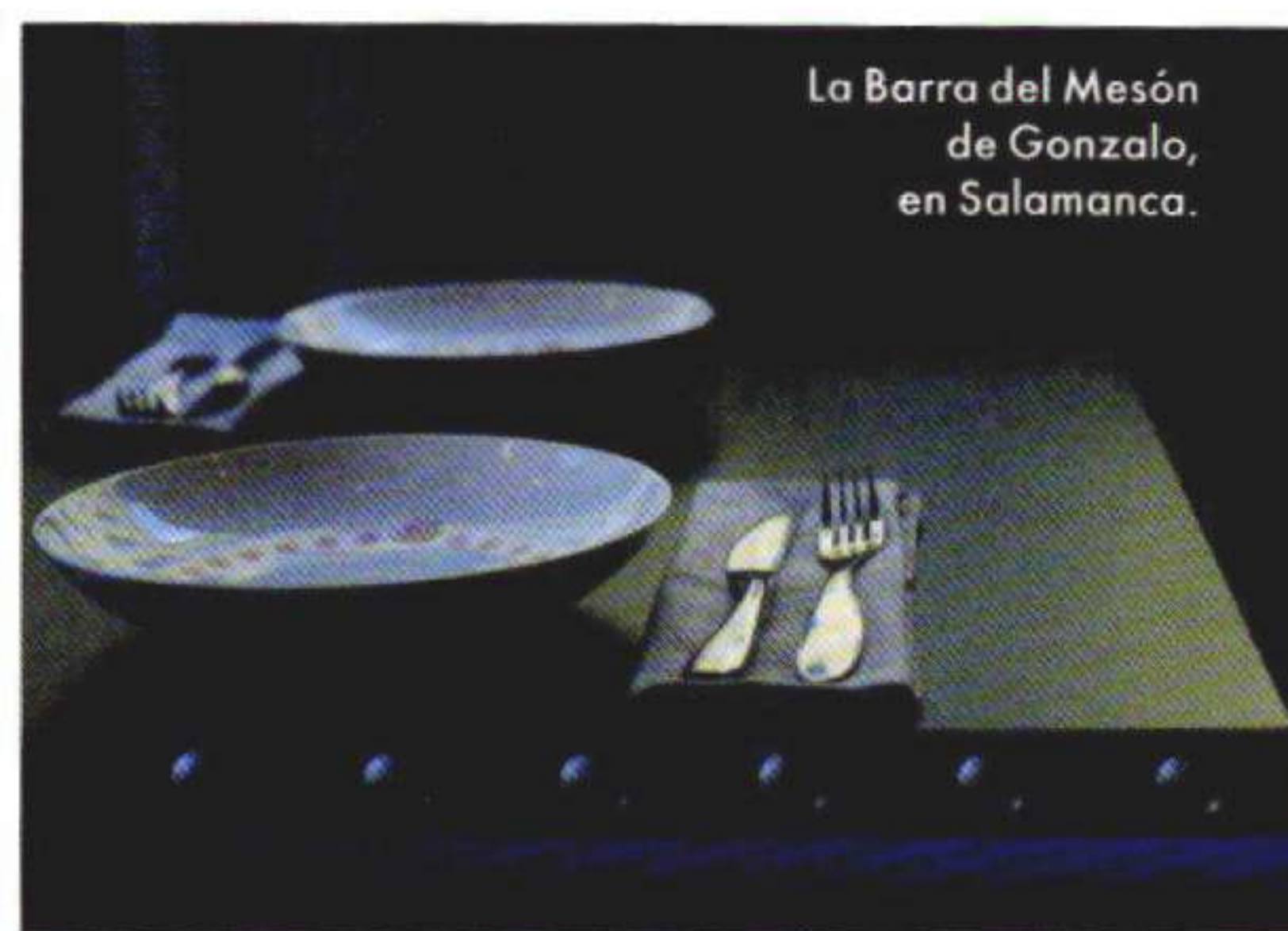
La Barra del Mesón de Gonzalo, en Salamanca.